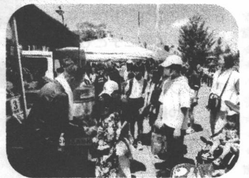
くじ引きには長い行列ができていました。