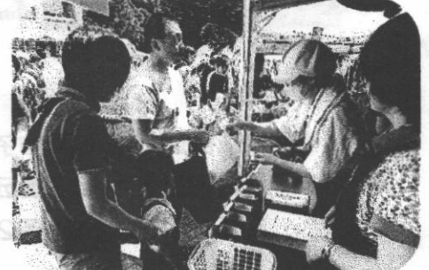
パステルカラーの綿あめも人気でした