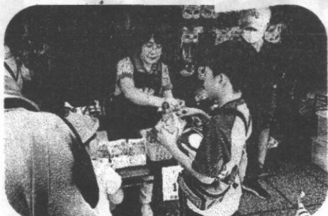
フレーバーが選べるポップコーンだよ!