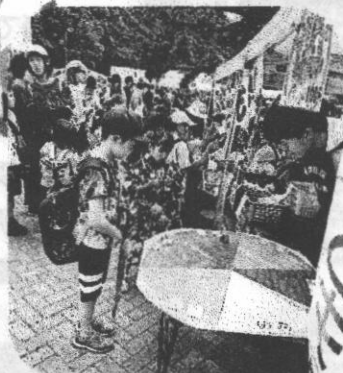
人気のチョロQルーレット!

好天の中開催された清田区民まつりに参加し、ヨーヨーつり、チョロQルーレット、くじ引き、綿あめ、ポップコーンのお店を運営しました。とてもたくさんのお客様が来場し、楽しんでいました。