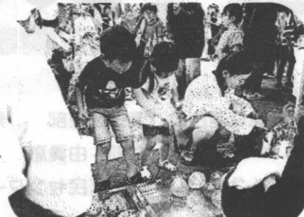
ヨーヨーつりを楽しむ子どもたち